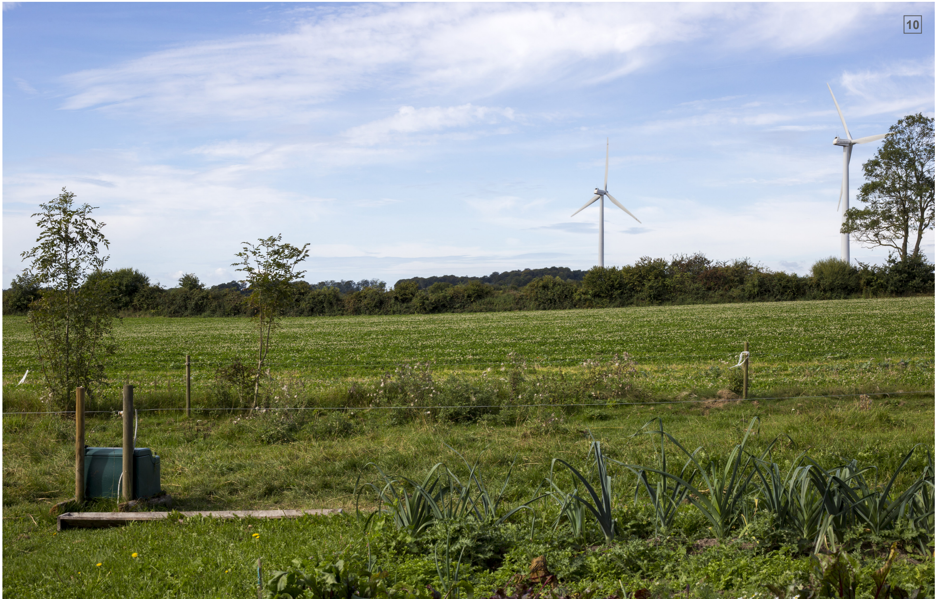
ØRBÆKVEJ 251 | FOTOSTANDPUNKT 10 | EKSISTERENDE FORHOLD