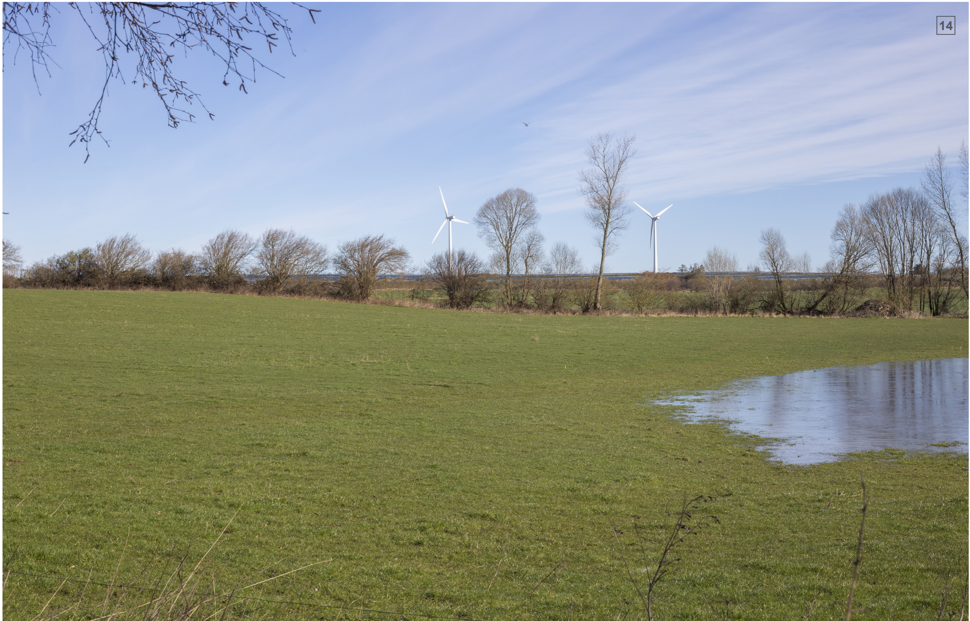
SORTEMOSEVEJ | FOTOSTANDPUNKT 14 | VISUALISERING MED LEVENDE HEGN (CA. 4 M)