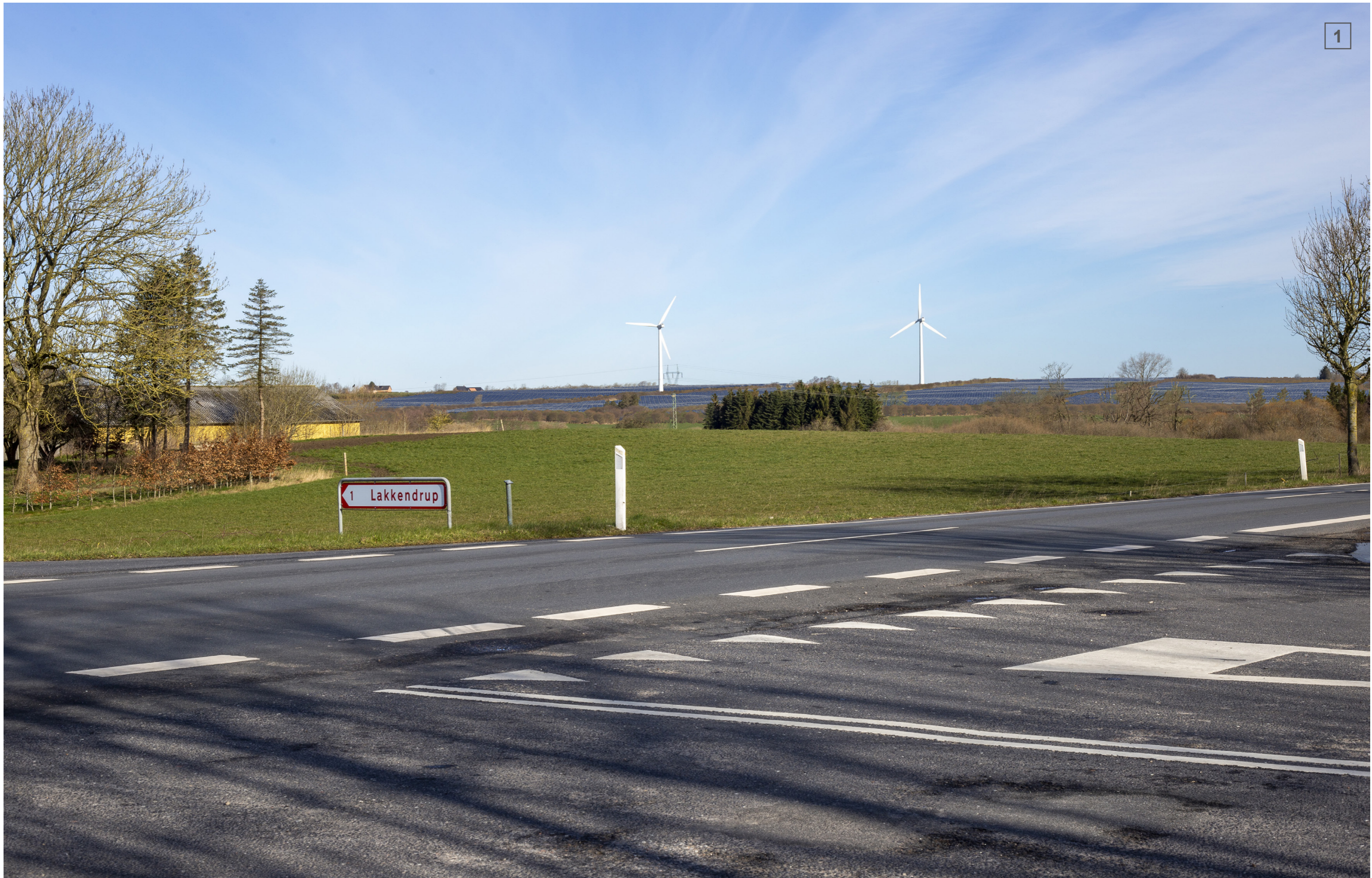
KILENVEJ | FOTOSTANDPUNKT 1 | VISUALISERING MED LEVENDE HEGN (CA. 4 M)